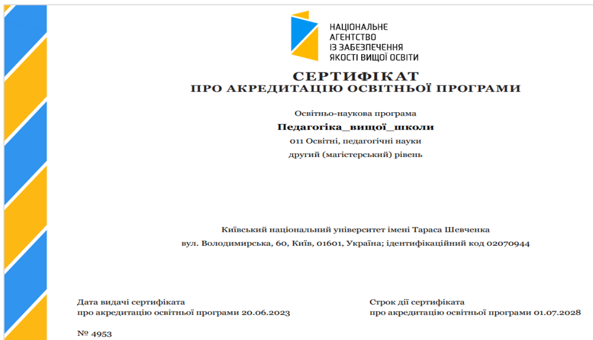
Рис. 1. Сертифікат про акредитацію освітньо-наукової програми "Педагогіка вищої школи"

У змісті Стандарту другого рівня вищої освіти спеціальності 011 знаходимо, що об'єктами вивчення в межах стандарту є системи освіти, освітні процеси у формальній і неформальній освіті, узагальнений соціально-педагогічний досвід, висвітлений у педагогічних теоріях, концепціях, контекстних (професійно орієнтованих) практиках, методики викладання освітніх курсів у закладах вищої освіти. Цілі навчання: підготовка фахівців, здатних розв'язувати актуальні проблеми, складні завдання дослідницького та/або інноваційного характеру у сфері освітніх, педагогічних наук, освітнього менеджменту й освітньої практики (Міністерство освіти і науки України, 2021). ОНП "Педагогіка вищої школи" у 2023 р. пройшла акредитацію в Національному агентстві із забезпечення якості вищої освіти, отримала про це сертифікат (рис. 1.).